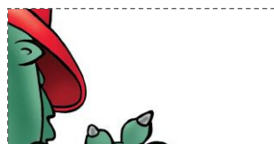
Soutěžní kupón č. 6

Jestliže už znáš správné odpovědi, označ je u příslušné otázky v odpovědním lístku stejně jako minule, tedy křížkem (X) označ vždy jednu správnou odpovědi A, B nebo C. A také nezapomeňte vystříhnout a nalepit pátý a šestý dílek mého obrázku. Další část soutěže najdeš za týden zase na tomto místě.