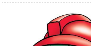
Soutěžní kupón č. 1